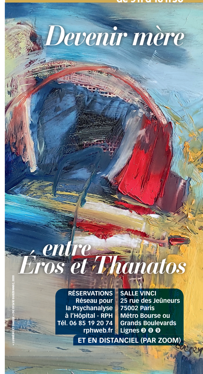
« LUMIÈRE ET OMBRE » DE SYLVIE GUÉZE INEC, 2020

RÉSERVATIONS Réseau pour la Psychanalyse à l'Hôpital - RPH Tél. 06 85 19 20 74 rphweb.fr SALLE VINCI 25 rue des Jeûneurs 75002 Paris Métro Bourse ou Grands Boulevards Lignes ② ⑧ ⑨